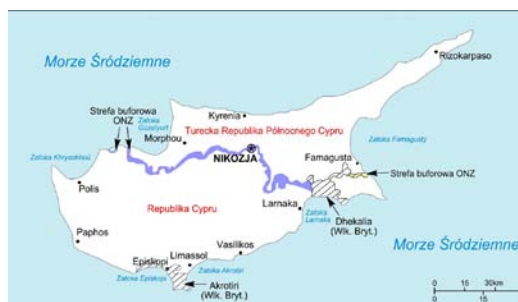
Cypr, na południu baza wojskowa Wielkiej Brytanii.

Mało tego, również Francja wysłała swój lotniskowiec „De Gaulle” w ten potencjalnie gorący rejon. A w poniedziałek 9 marca przylecieli na Cypr prezydent Francji Macron i premier Grecji Mitsotakis na trójstronne spotkanie z prezydentem Cypru Nikosiem Christodulidisem, by zapewnić o gotowości wspólnej obrony republiki cypryjskiej przed jakimkolwiek atakiem. ▶