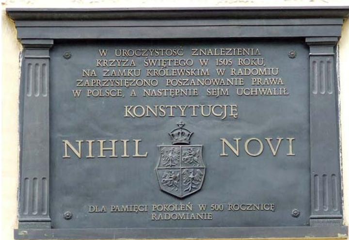
Tablica upamiętniająca uchwalenie w 1505 roku Nihil novi na zamku w Radomiu.

Proszę Państwa, wszyscy ludzie są braćmi. Nie dlatego, że tak zadekretowała rewolucja francuska. Jesteśmy braćmi, bo mamy jednego Ojca. Kto się nie zgadza z tym, że mamy jednego Ojca, to niech od tego odstąpi. Ale jeżeli uważa, że Ojcem całej ludzkości jest Bóg,