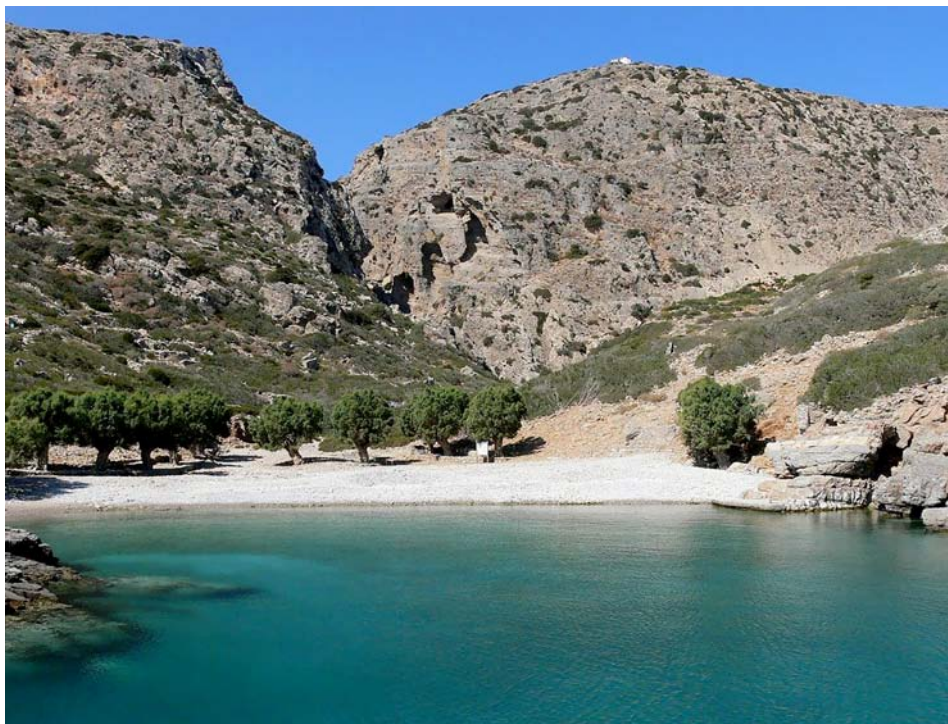
Grecja wyspa Karpathos.

Grzegorz Braun w swoim antysemitkim i jednocześnie antyamerykańskim wrzeniu uznał za zasadne urządzić pokaz wdzięczności i żalosnej kreacji braku jakiegokolwiek politycznej wizji oraz zwykłego, ludzkiego taktu. Czy następną będzie ambasada Korei Północnej?