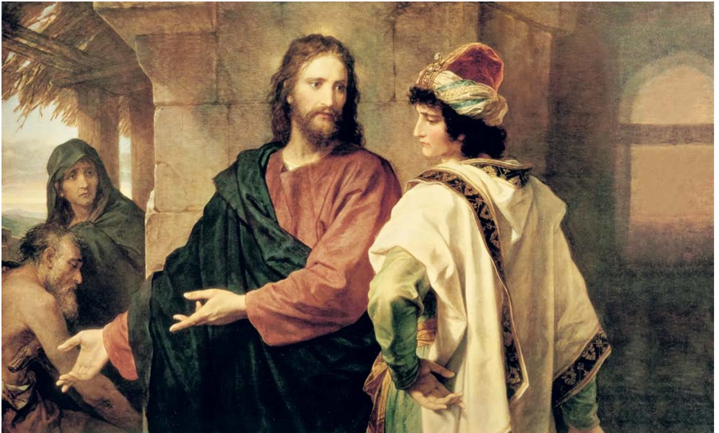
Chrystus i bogaty młodzieniec Heinrich Hofmann.

► nicznego Izraela jako całości, lecz z owej „wiernej Reszty”.