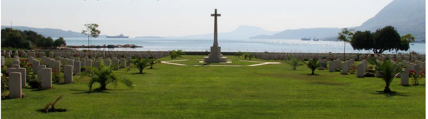
Suda na Krecie, aliancki cmentarz z czasów II wojny światowej, niedaleko morskiej bazy NATO.

Nasze historyczne, niekiedy tragiczne, doświadczenia w relacjach z sąsiedami usprawiedliwiają w dostatecznym wymiarze te wyrzekania, ale też przesłaniają kilkusetletnią imponującą historię rozkwitu I Rzeczypospolitej jako państwa znaczącego i poważanego na kontynencie europejskim.