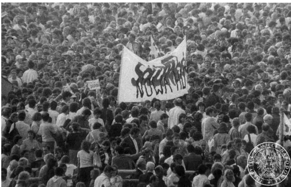
Jan Paweł II na Błoniach w Krakowie 10 czerwca 1987.

Polska w najbliższych latach stanie przed bardzo poważnymi zagrożeniami. Narastające niemal wszędzie od pół wieku nierówności generują poczucie krzywdy, stan napięcia i niepokoje społeczne, nierzadko spiralę nienawiści, która na zasadzie sprzężenia zwrotnego narasta i – jak to nienawiść – staje się ślepa. Stąd coraz więcej buntów społecznych kierowanych przez władców ku wrogom zewnętrznym, co najczęściej jest przyczyną wojen. A my nie przestaliśmy leżeć między Rosją a Niemcami. Trwałe zaś, do niedawna, więzi, zapewniające nam bezpieczeństwo, jak NATO i wspólny rynek integrującej się Europy, zdają się w związku z tym przyrostem napięcia i egoizmów grupowych, tracić na pewności i sile. Być może zbliżając się do statusu dawanych nam przez naszych sojuszników gwarancji przed II wojną światową.