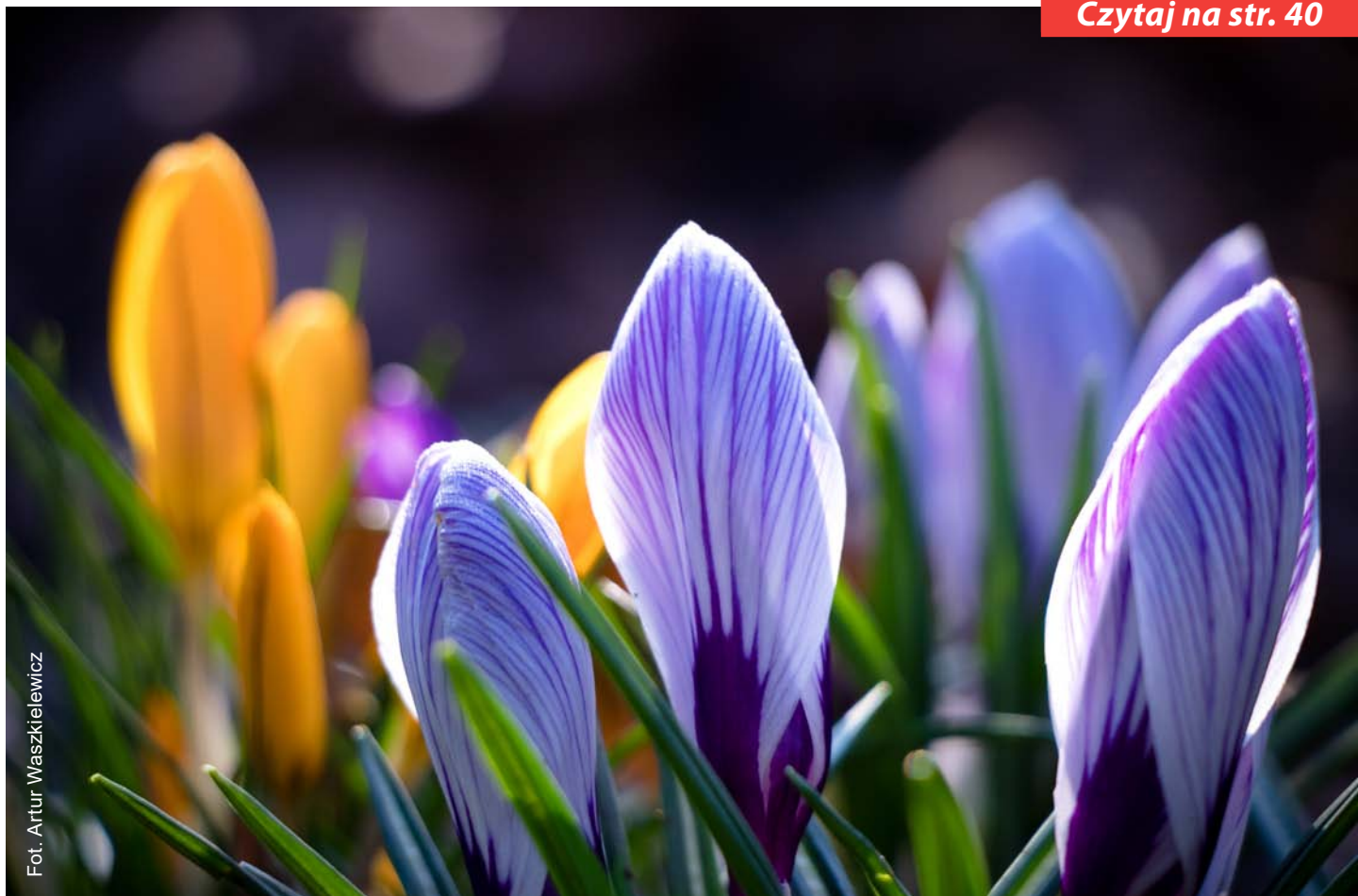
Fot. Artur Waszkielewicz