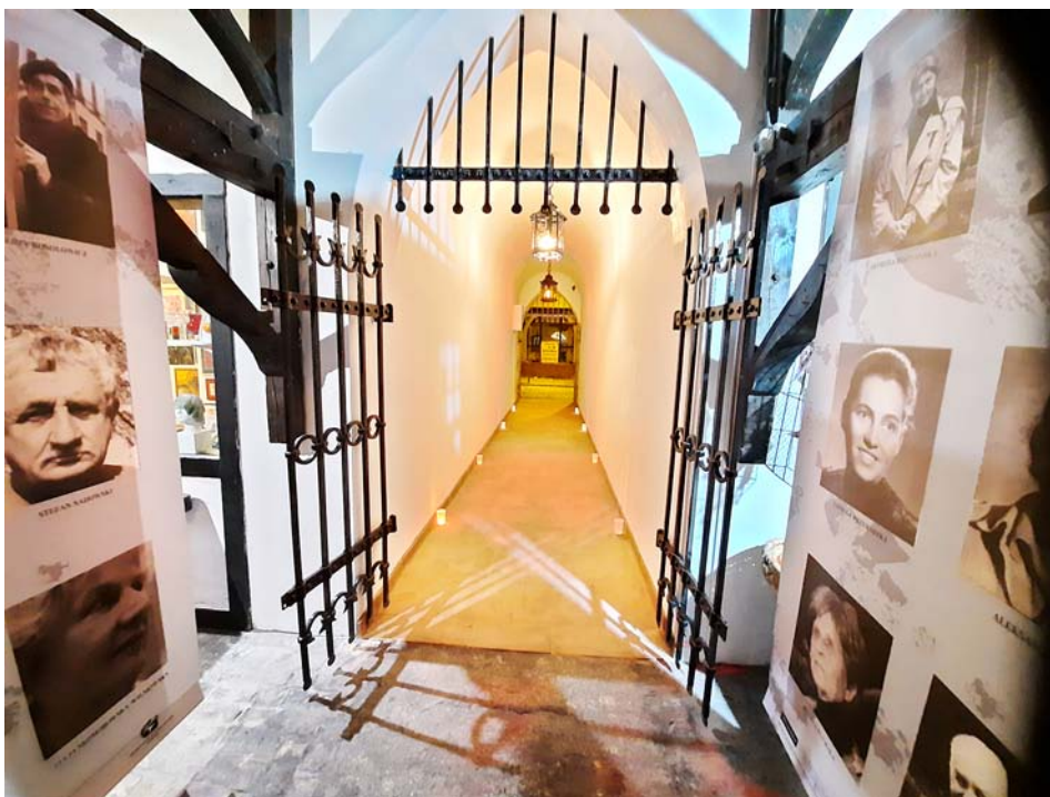
Mysterium Zaduszkowe 2025 na wrocławskich Jatkach