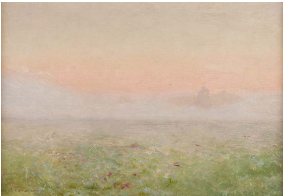
Józef Chełmoński, Świt, 1892, Muzeum Narodowe w Krakowie