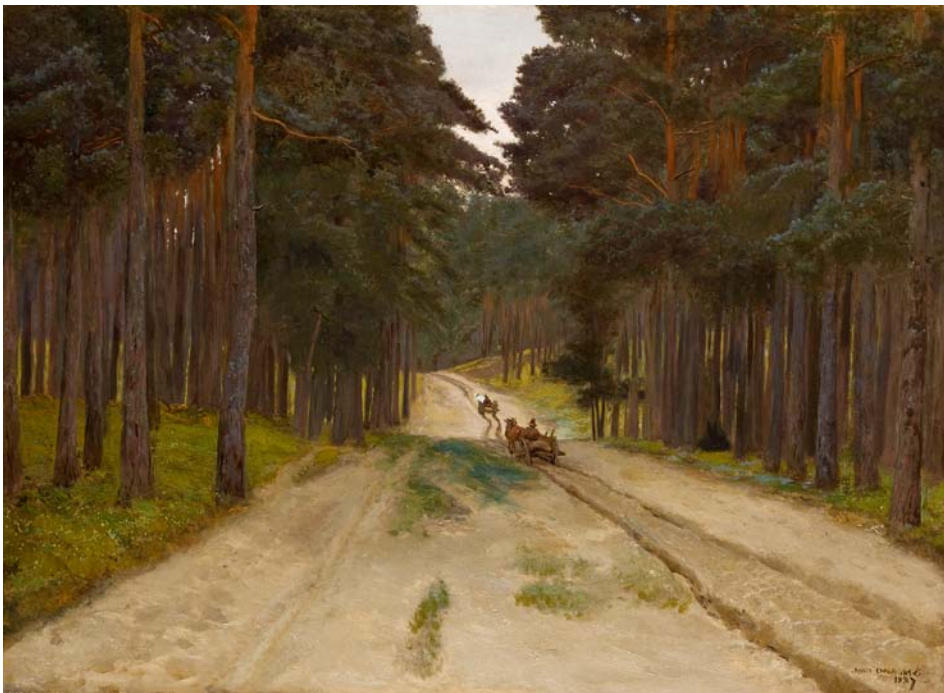
Józef Chełmoński, Droga w lesie, 1887, Muzeum Narodowe w Krakowie

■ Nie dożył odzyskania przez Polskę niepodległości. Zmarł cztery miesiące przed wybuchem I wojny światowej, która zakończyła się dla nas upragnioną wolnością. Ale bez takich genialnych twórców kultury i ducha nie zdołalibyśmy ocalić polskości. A polskością przesiąknięta jest na wskroś cała twórczość Józefa Chełmońskiego. Jednego z największych polskich malarzy, którzy swoimi dziełami wytyczali kierunki malarstwa światowego. Jeszcze za jego życia poznali się na nim koneserzy sztuki w Europie i Ameryce.