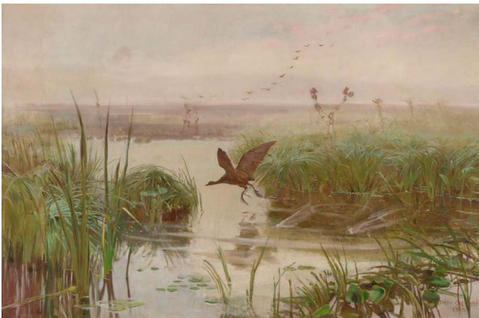
Józef Chełmoński, Kurka wodna, 1894, Muzeum Narodowe w Warszawie

Miał nieprawdopodobne zamiłowanie do polskiej ziemi. Z wielkim pietyzmem i starannością ukazywał obrazy z życia polskiej wsi, sceny rodzajowe, pędzące konie, chłopów przed karczmą, rozległe nostalgiczne pejzaże. Któż nie zna jego słynnych dzieł: Babiego lata, Bocianów czy Burzy. Mniej znane są natomiast subtelne krajobrazy czy szereg dzieł ukazujących ptaki w ich naturalnym środowisku.