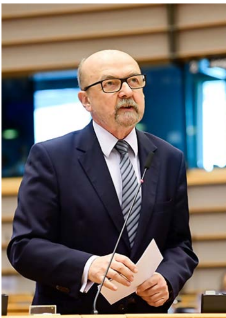
Prof. Ryszard Legutko

Człowiek w swym czynie ma spełniać siebie, jak na to wskazywał kardynał Karol Wojtyła w książce „Os-