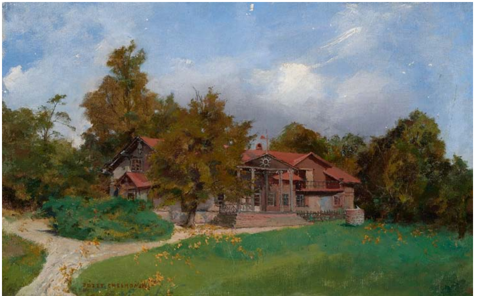
Willa w ogrodzie – Kuklówka. Po 1889 roku, Muzeum Narodowe w Warszawie

Zamieszkał w Kuklówce, początkowo ze starszymi córkami, później zupełnie sam. Wycofał się z życia towarzyskiego, ograniczając kontakty do starych przy-