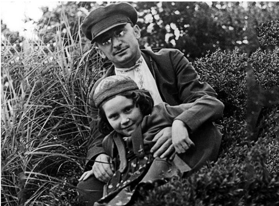
Ławrientij Beria z córką Stalina, Swietłaną

Od śmierci jednego z najbliższych Stalinowi przywódców minęło ponad 65 lat. Jednak 25 lat po upadku komunizmu i rozpadzie Związku Sowieckiego historia jego aresztowania, śledztwa, wyroku i rozstrzelania nadal stanowi jedną