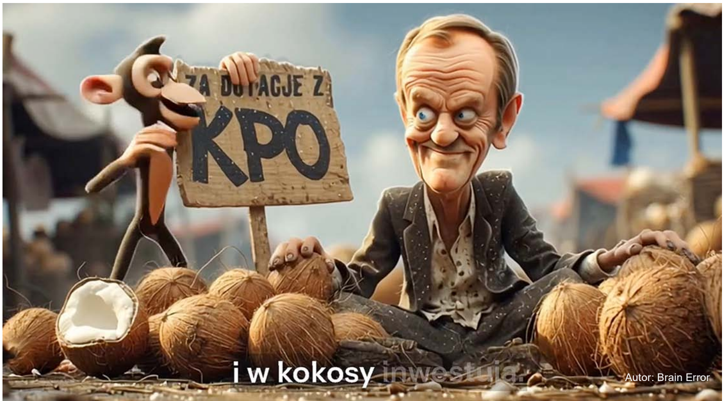
Autor: Brain Error

▪ Bilionowe zadłużenie, milionowe bezrobocie, zapaść w służbie zdrowia, rolnictwo zagrożone, strategiczne inwestycje w impasie – administracja 13 grudnia nie jest w stanie realizować konstytucyjnej zasady społecznej gospodarki rynkowej.