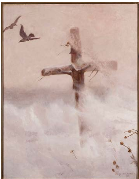
Józef Chełmoński, Krzyż w zadympce, 1907, Muzeum Narodowe w Warszawie