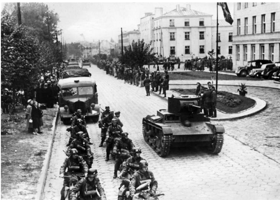
Niemiecko-sowiecka parada zwycięstwa Brześć nad Bugiem 22.09.1939

Niemcy dostarczali technologię, Sowieci przestrzeń. Transakcja była prosta: know-how za ziemię. A wszystko to pod przykrywką „współpracy naukowej”. Gdyby nie skala zniszczeń, można by uznać to za przykład udanej synergii.