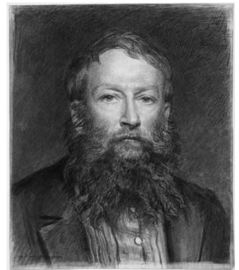
Józef Chełmoński, Autoportret z okresu przed 1904, kolekcja Muzeum Narodowego w Krakowie