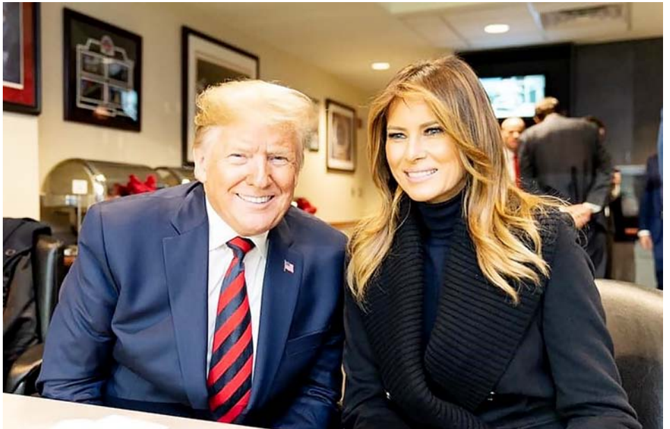
W czasie swojej prezydentury Donald Trump żądał od państw członkowskich NATO wywiązywania się z zobowiązań finansowych.

Jeśli w tej wypowiedzi jest zachęta Rosji do agresji na inne państwo, to trzeba mieć złą wolę i chęć przypisywania Trumpowi demonicznych zamiarów. Były prezydent mówił jasno, że trzeba zachęcać inne państwa, wręcz zmuszać je do ponoszenia kosztów. Że ich bezpieczeństwem nie można obarczać wyłącznie amerykańskiego podatnika. Powie-